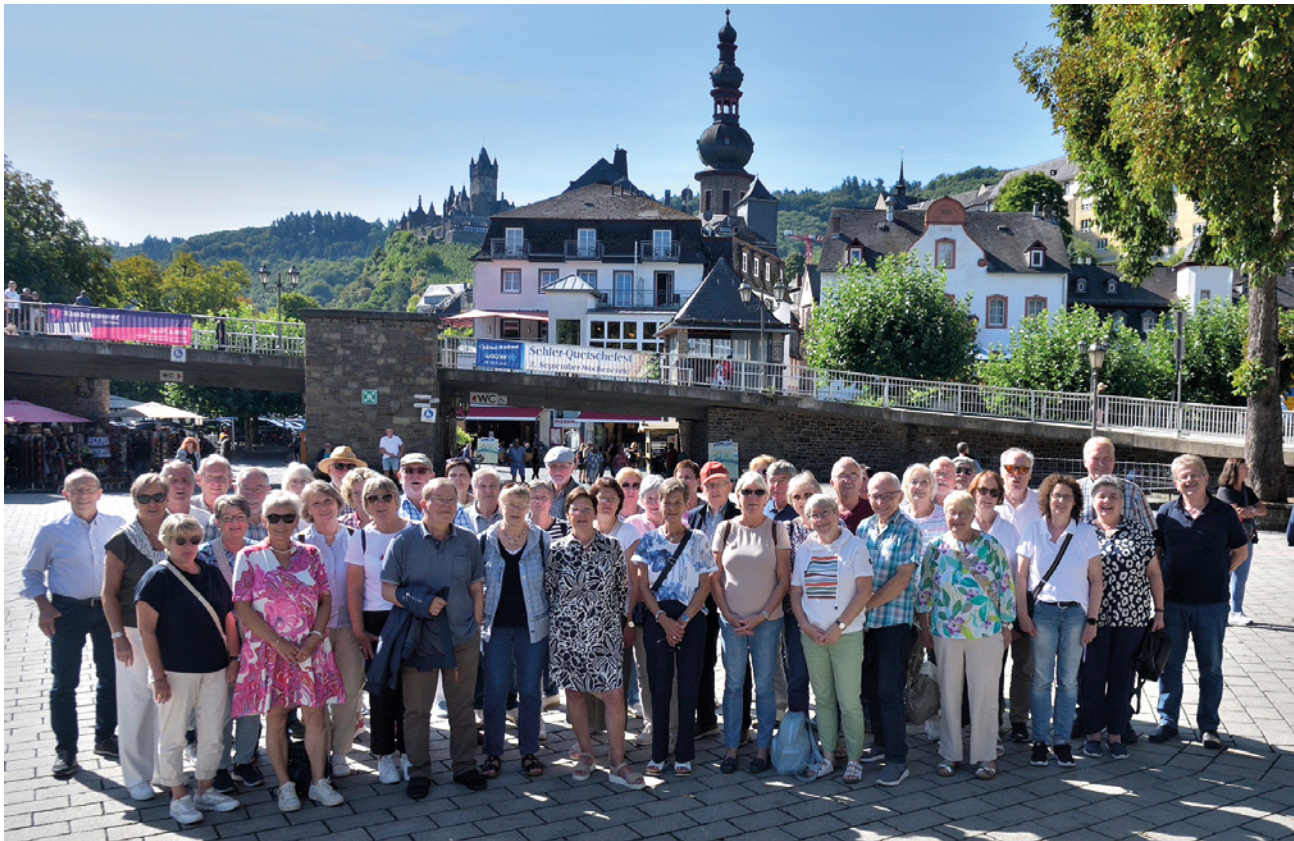
Eine tolle Tour nach Trier, Luxemburg und an die Mosel hatte der Heimatverein Nortrup organisiert.

Koffer gepackt, der Bus stand bereit, schon ging es am letzten Tag zurück Richtung Heimat. Die Reise führte entlang der Mosel durch die wunderschöne Landschaft nach Cochem. Die Reichsburg Cochem ist eine Burganlage in der rheinland-pfälzischen Stadt Cochem. Sie ist ihr Wahrzeichen und steht oberhalb der Stadt. Nun ging es weiter Richtung Heimat. Alle waren sich einig, es war wieder eine tolle Tour. Ein Dankeschön ging natürlich an die Organisatoren, auch an Heinz-Josef Heile für die vielen Fotos, die die Teilnehmer dann im Fotobuch wieder finden werden.