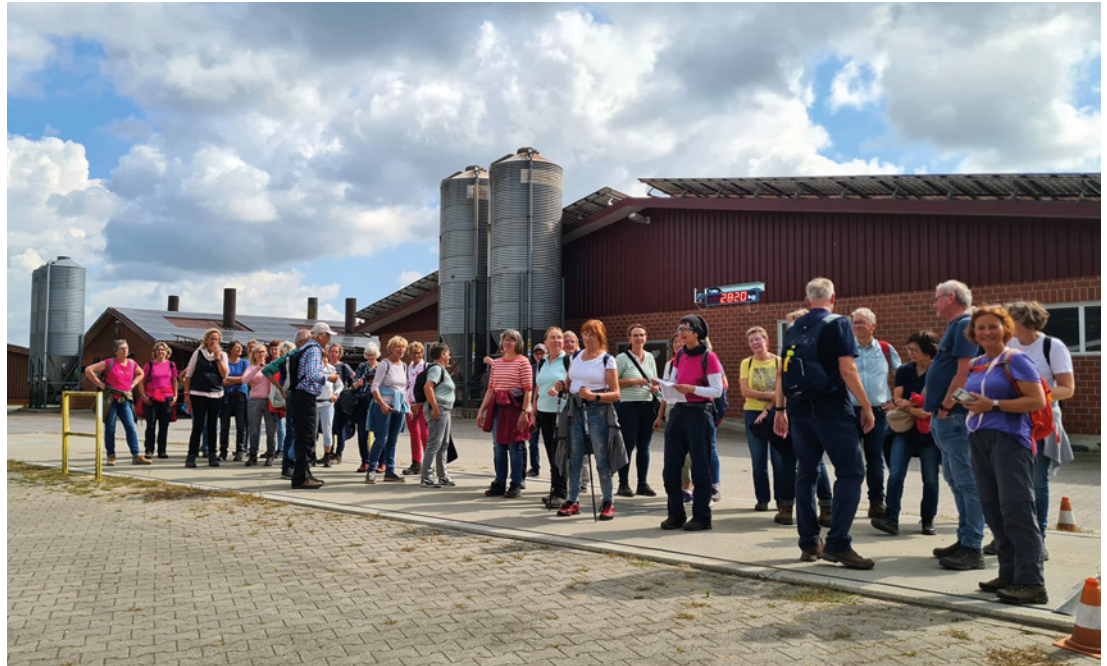
Das Bild zeigt die Wandergruppe bei der Tour „Abseits bekannter Pfade“ in Lodbergen, als diese zufällig eine Fahrzeugwaage passierte und die Gelegenheit gleich zum gemeinschaftlichen Wiegen nutzte.

PPS: Der Bach trägt seit Anfang des 19. Jahrhunderts den Namen Affebach. Leider verbirgt sich dahinter eine traurige Geschichte: Damals zog durch Helmighausen-Evenkamp ein Zirkus, der für Geld und Waren (Lebensmittel) etwas vorführte. Diese Truppe hatte unter anderem einen Affen, den sie den Zuschauern vorführten. Dieser Affe ist damals ausgebüxt und wurde später ertrunken in diesem Bach wiedergefunden.