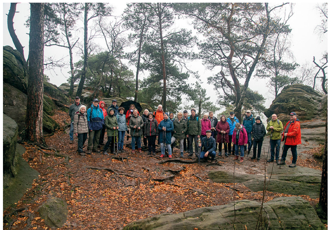
Zu den Dörenther Klippen führte die diesjährige Herbstwanderung des Heimatvereins Melle/Neuenkirchen.

sonderer Dank galt den Organisatoren für die vorbildliche Vorbereitung.