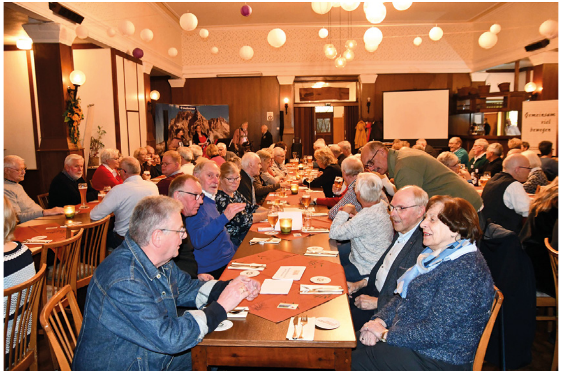
Eine fröhliche Stimmung herrschte bei der Jahresabschlussitzung mit anschließendem Grünkohllessen des Kreisheimatbunds Bersenbrück (KHBB) in Engter.