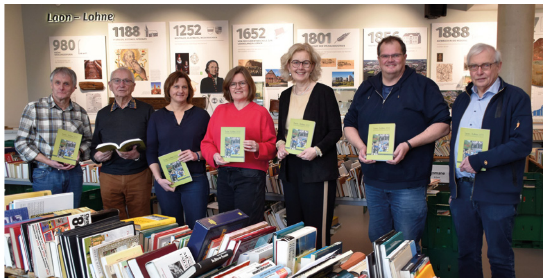
Vorstellung des Jahresbands Laon-Lohne 2025 mit den Verantwortlichen für Text- und Bildredaktion, Lektorat, Layout, Druck und Vertrieb.