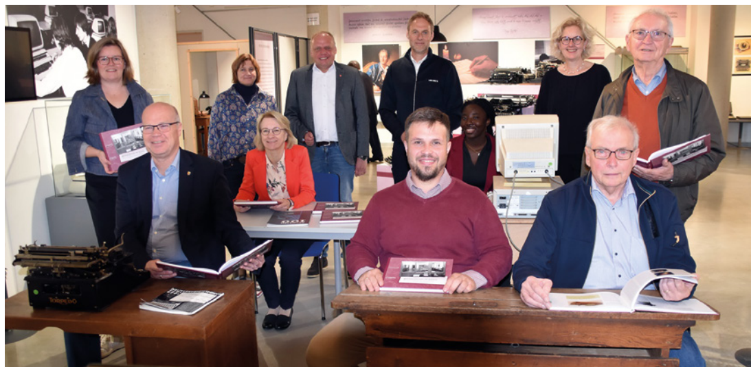
Ausstellung „R|Evolution im Büro“ mit den Erstellern des Begleitbands sowie den Förderern