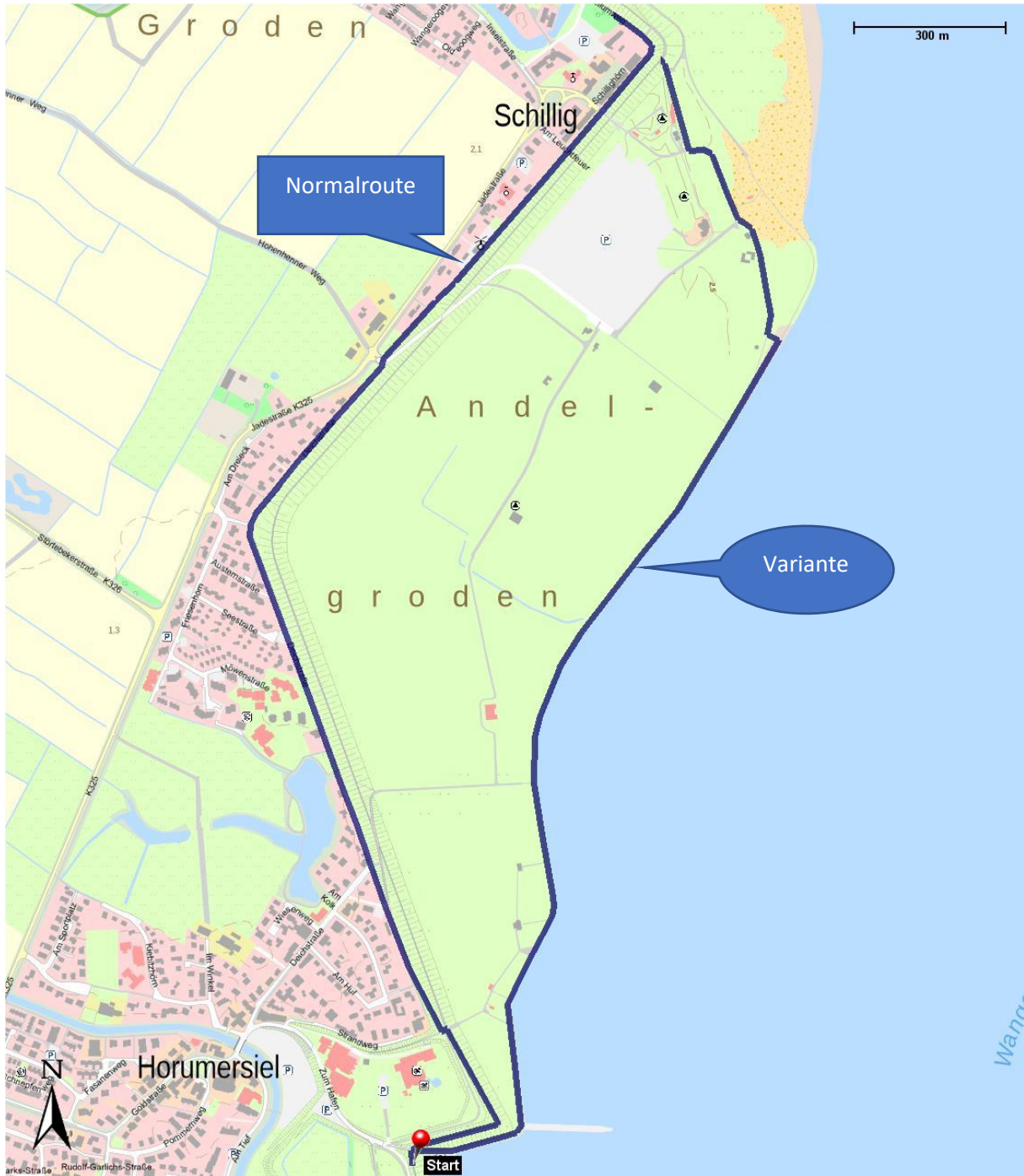
Variante in Schillig. Kartengrundlage: geolife.de