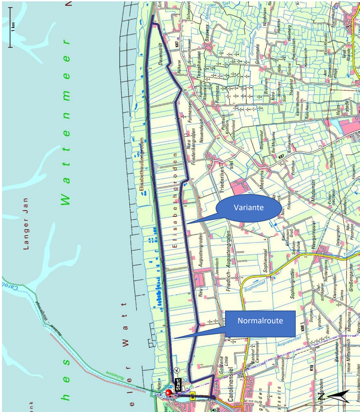
Variante ab Carolinensiel. Kartengrundlage: geolife.de

Der Störtebekerweg wird dann in einem weiten Bogen südlich um diese Erinnerungstätte herumgeführt und folgt nun auf einer längeren Strecke dem Ufer nach Nordwesten.